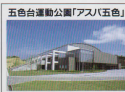
五色台運動公園「アスパ五色」

初日 [受付] 8:30 [開会式] 9:00 [競技開始] 9:30 予選リーグ戦 2日目 [受付] 8:00 [競技開始] 9:00 決勝・交流トーナメント戦