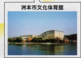
洲本市文化体育館