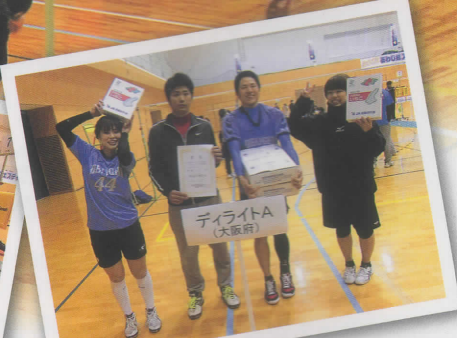
五色台運動公園「アスパ五色」