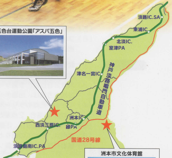
洲本市文化体育館